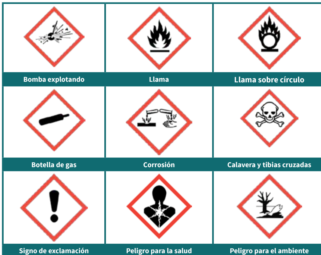
Tabla 2 – Pictogramas del SGA