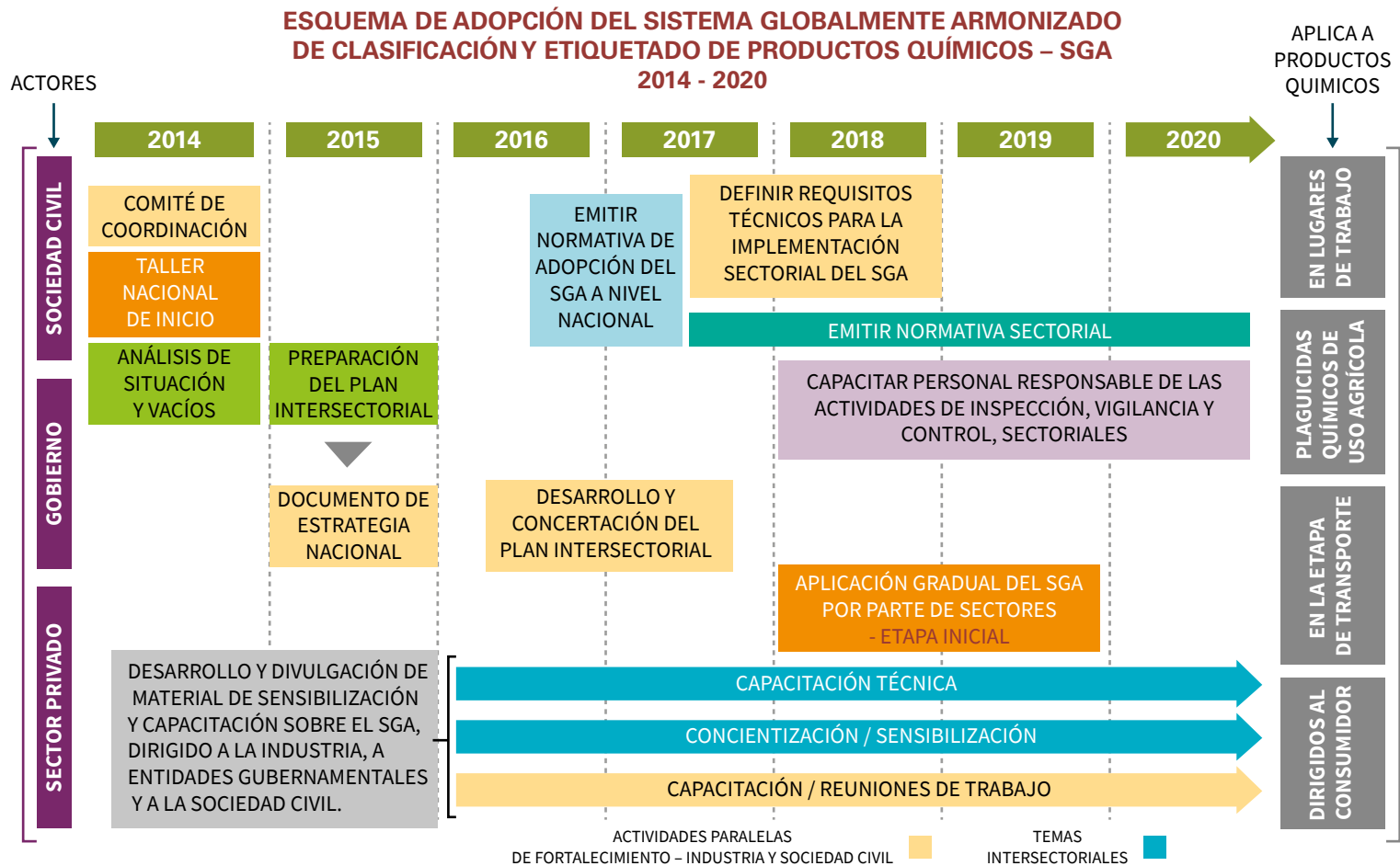
Figura 1 – Esquema de adopción del SGA en Colombia